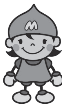
下水道あいちゃん