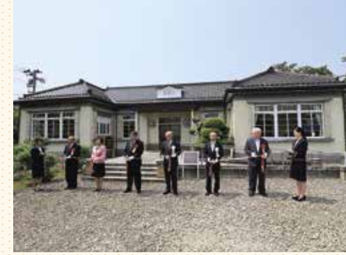
和洋折衷のモダンな建築様式の外観